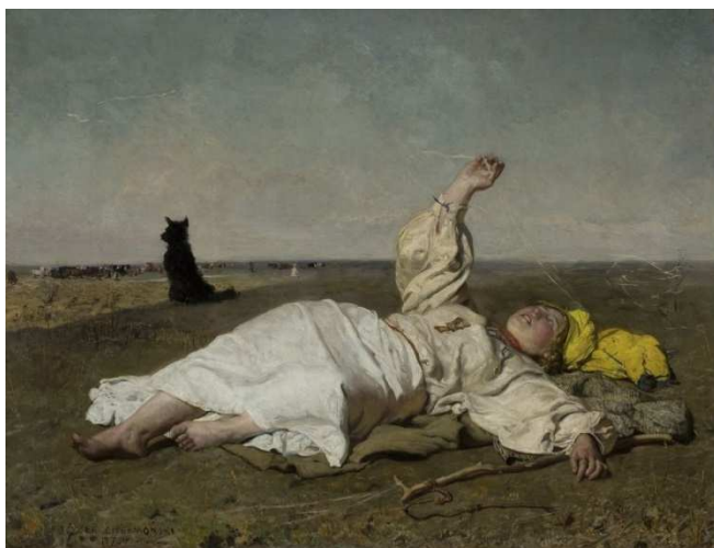
A to już „Babie lato” Józefa Chełmońskiego

https://www.youtube.com/watch?v=Sk8kG96VGel