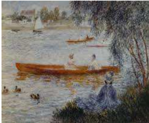
Pierre Auguste Renoir

https://www.youtube.com/watch?v=Sk8kG96VGel